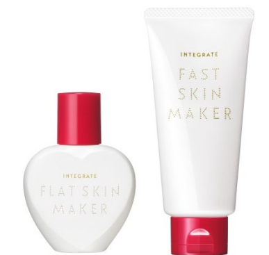
左から、 インテグレート フラットスキンメーカー N、 同ファストスキンメーカー

20～30 代女性への取り組みも積極的に展開する全国のマツモトキヨシグループ店舗(調剤店舗を除く)にて数量限定発売します。